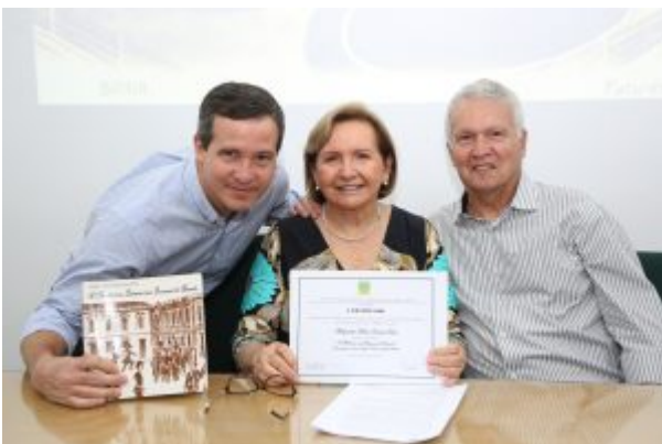
A família da agora Confreira, prestigiou sua posse no IBHM (filho e esposo, também médicos)