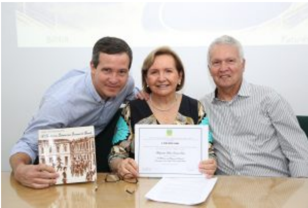
A família da agora Confreira, prestigiou sua posse no IBHM (filho e esposo, também médicos)